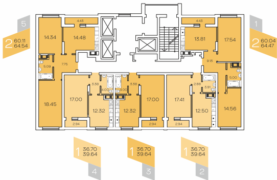
Дом – II Подъезд – 3